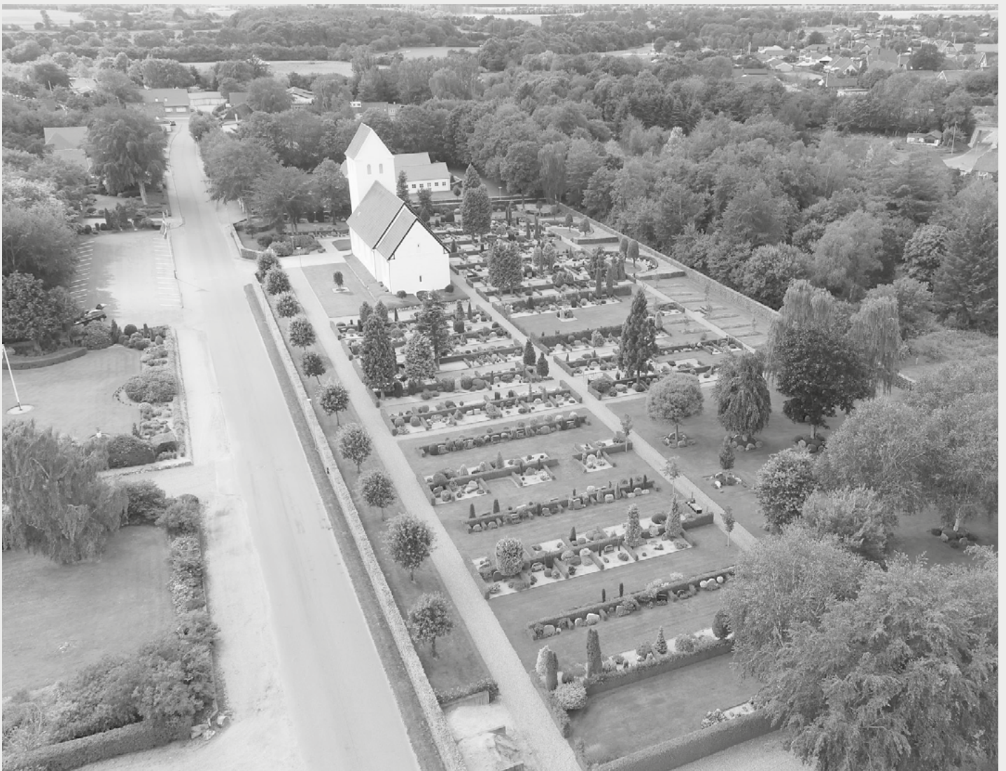
Agerbæk Kirke og Kirkegård august 2019.