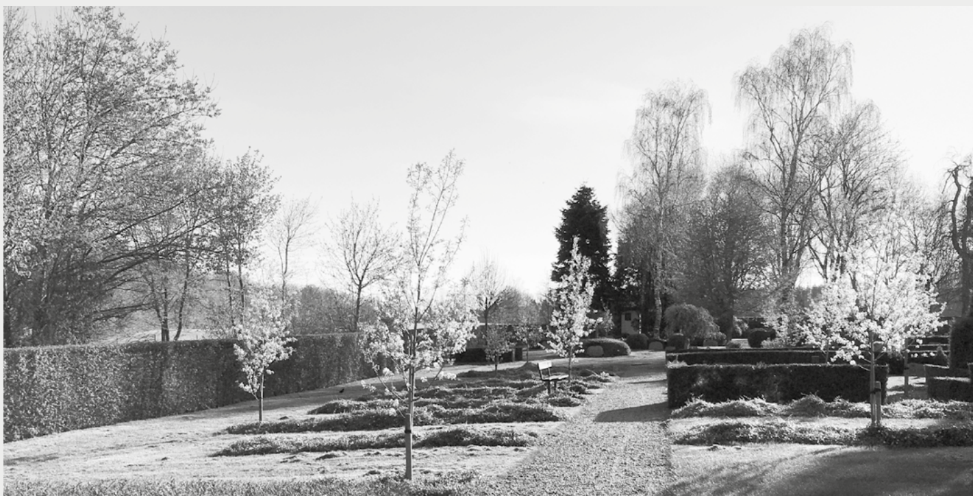
Forårsbillede fra kirkegården.

Hvor intet andet er nævnt afholdes møderne på Fristedet, Jernbanegade 3, Agerbæk.